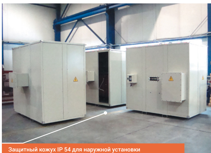
Защитный кожух IP 54 для наружной установки