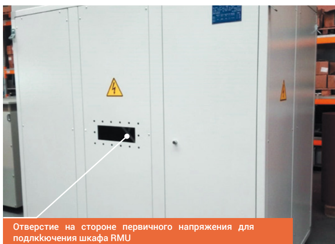
Отверстие на стороне первичного напряжения для подключения шкафа RMU