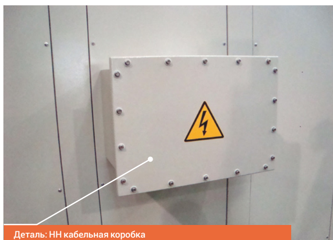
Деталь: НН кабельная коробка

Чтобы удовлетворить рыночный спрос компания Power Sp. z o.o. разработала и запустила производство стандартных, а также специальных трансформаторов в защитных кожухах, оборудованных и спроектированных в соответствии с конкретными потребностями. Согласно требованиям клиентов мы поставляем низковольтные шины, кабельные коробки, шпильки ввода ВН. Наши кожухи могут также поставляться с отверстиями и алюминиевыми плитками на верхней/нижней или боковых стенках кожуха. Мы поставляем также кожухи оборудованные двумя дверями со стандартными или специальными замками.