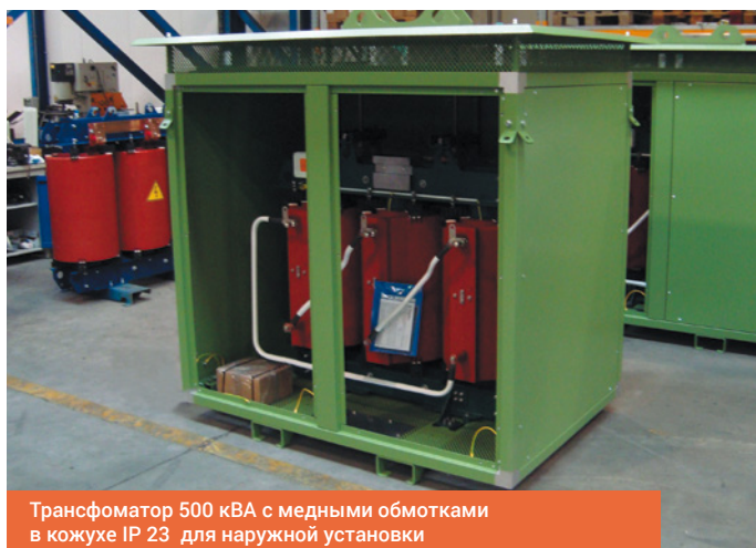
Трансформатор 500 кВА с медными обмотками в кожухе IP 23 для наружной установки