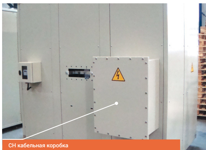
СН кабельная коробка