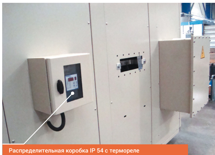
Распределительная коробка IP 54 с термореле